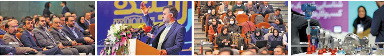
توسط مدیرعامل شرکت مهندسی آبیای کشور انجام گرفت:

به گفته وی هدف گذاری فولاد مبارک در این راستا بوده