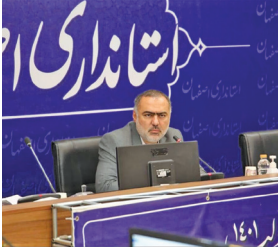
با اعتباری بالغ بر ۱۴ هزار میلیارد تومان انجام می‌شود: