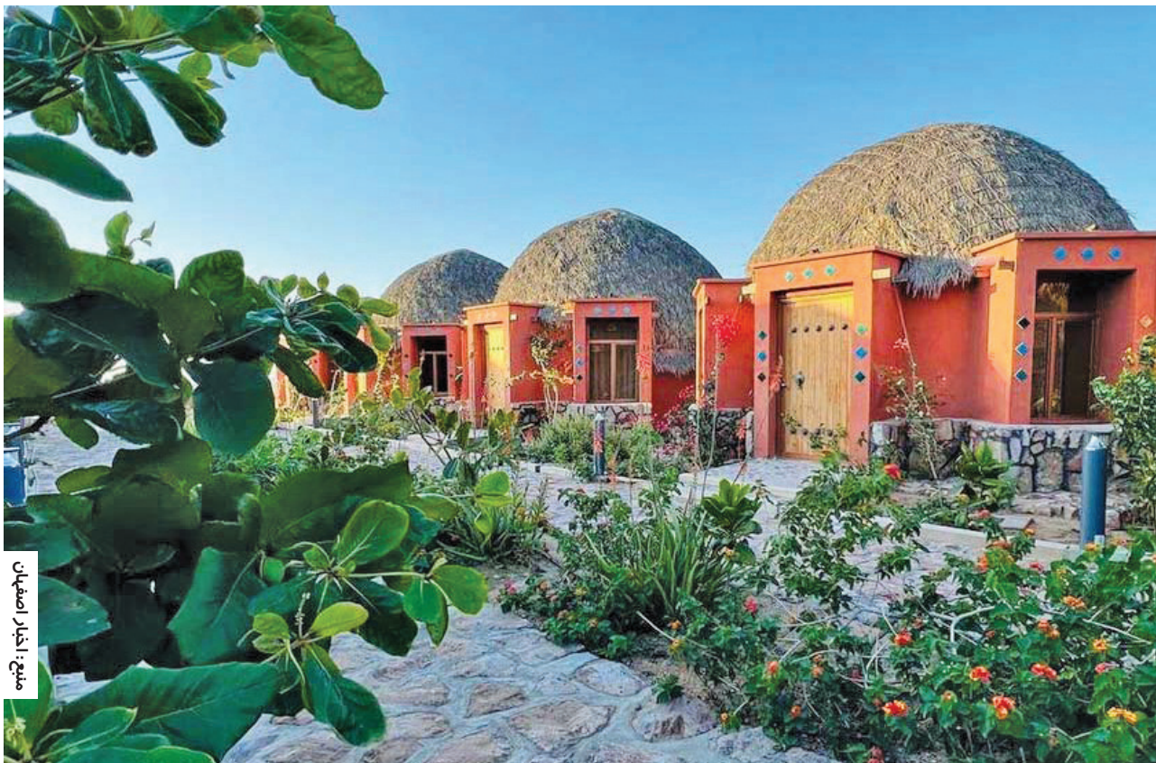
شیخ اخبار اصفهان

مدیرکل میراث فرهنگی، گردشگری و صنایع دستی اصفهان خبر داد: