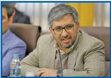
مدیرعامل شرکت پشتیبانی توسعه فناوری و نوآوری فولاد مبارکه مظهر کرد: