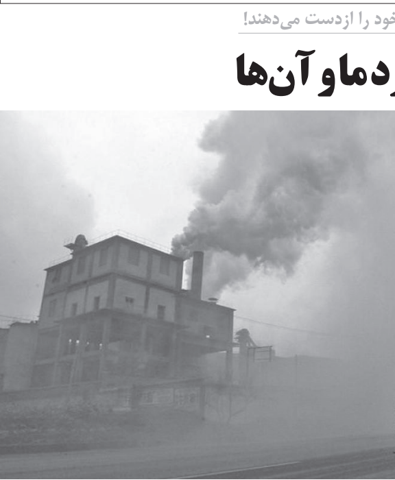
یک تصویر از یک کارخانه تولید فولاد در استان اصفهان

درصد خودروهای دارای کاتالیست، با محدودیت‌های ترافیکی روبه‌رو می‌شوند. مبدل کاتالیست، قطعه‌ای از خودروست که گازهای سمی را به گازهای کم‌ضرر تبدیل می‌کند. از دیگر اقدامات باید به توقف فعالیت ۵۰درصد از کارخانه‌های صنعتی و صنایعی که با سوخت چوب فعالیت می‌کنند اشاره کرد. این اقدامات معمولاً حدود ۲۰درصد از آلودگی هوا می‌کاهد.