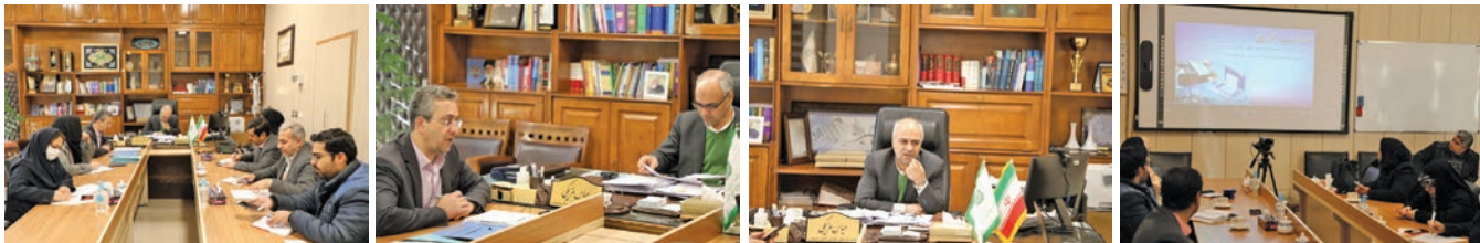
رئیس کنترل کیفی خورد گرم فولاد مبارک اعلام کرد:

البته دولت به دنبال آن نیست که افزایش درآمدهای مالیاتی منجر به فشار غیر متعارف و مضاعف بر فعالان اقتصادی شود. مزیکی اضافه کرد: با توجه به اجرائی شدن این قانون برای کسبه، لازم است این افراد به امور خود نظم دهند و فعالیتشان را شفاف کنند. همه اشخاص حقیقی و حقوقی در نهایت باید از این سامانه استفاده کنند. جریمه تخلف در این زمینه ۱۰ درصد سود فروش و یا حداقل دو میلیون تومان است. تلاش شده است جلساتی برای تیبیین این موضوع برگزار شود. وی ادامه داد: بیرند، امروز در تخصیص ارز دولتی مالیات بر عایدی سرمایه و مجموع دارای ها نیازمند شفاف سازی است که با نهایی شدن قانون پایانه های فروشگاه عملی مسئله نیز رفع می شود.