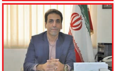
رئیس اداره ارتباطات و اطلاع‌رسانی اداره کل راه و شهرسازی استان اصفهان خیر داد: