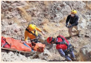
سخنگوی آتش‌نشانی و خدمات ایمنی شهرداری اصفهان گفت: ۲ مرد جوان بر اثر سقوط از کوه صُفه واقع در جنوب این کلاشهر جان باختند و