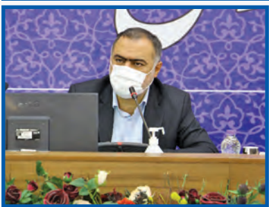
معاون عمرانی استاندار اصفهان خبر داد: