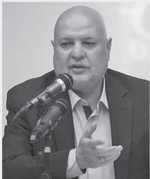
The head of Iran's Planning and Budget Organization (PBO) has said 40 percent of the oil revenues