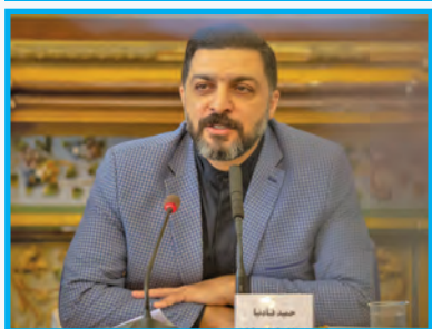
معاون جیاد کشاورزی اصفهان: